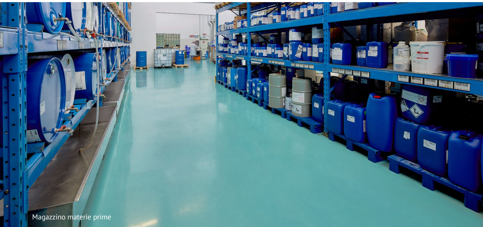
Magazzino materie prime