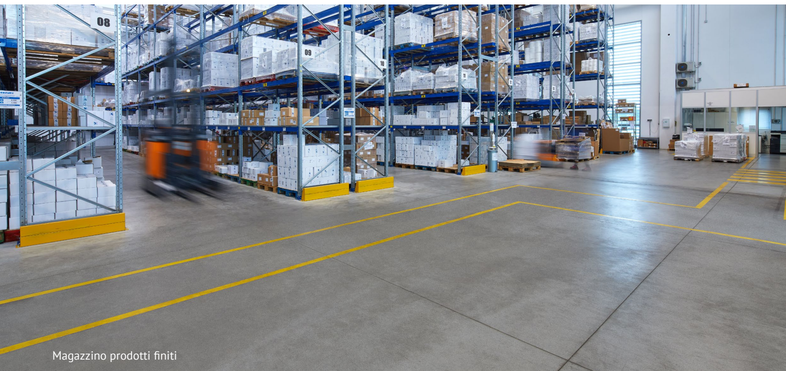
Magazzino prodotti finiti

Nel 2018, a seguito della costruzione del nuovo magazzino per lo stoccaggio dei prodotti finiti, Recodi realizza al piano terra su massiciata un pavimento industriale in calcestruzzo RECOLESS a grandi campiture per uno spessore di 20 cm e di circa 750 mq;