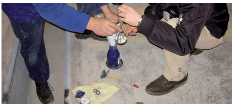
Misurazione contenuto di umidità nella pavimentazione

Il continuo passaggio di carrelli, l'impiego di sostanze chimiche e gli urti accidentali influivano in modo determinante sulle superfici, per questo RECOSINT RV e REPOX MALTA si sono dimostrati la soluzione perfetta. L'intervento si è sviluppato in diverse fasi, la prima delle quali è stata la demolizione e il ripristino delle parti di sottofondo ammalorato con betoncino epossidico.