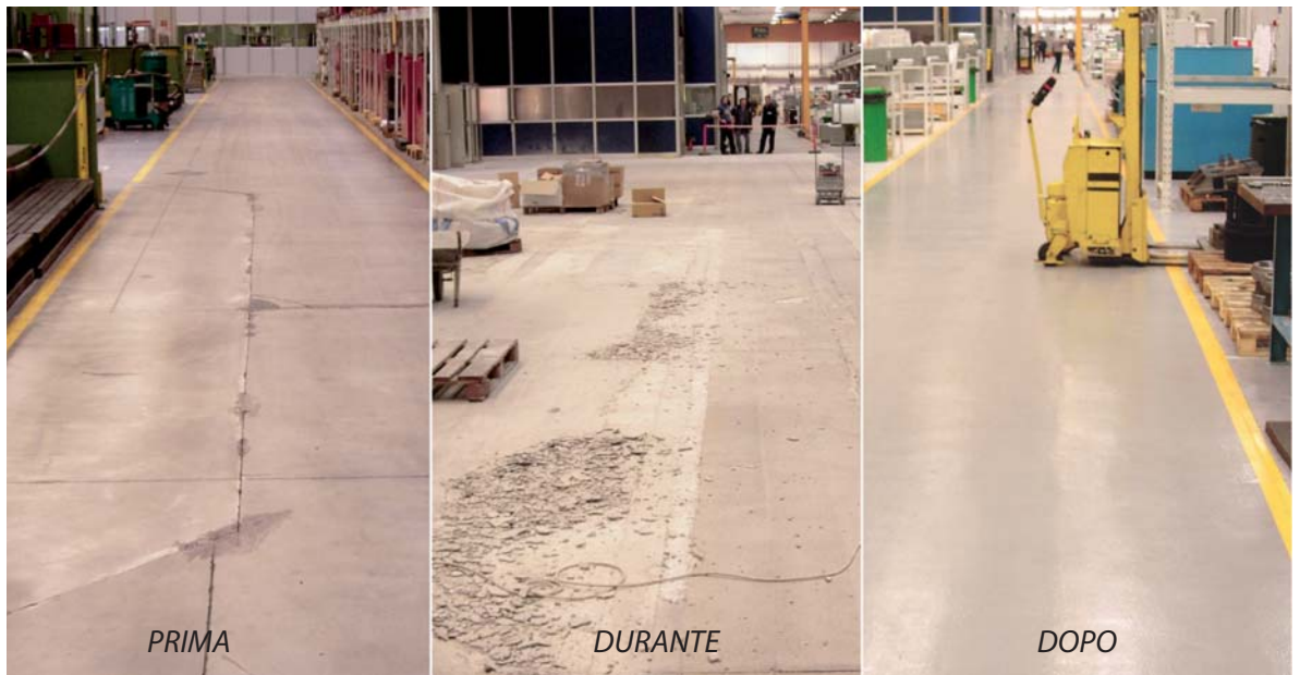
Ricostruzione delle pavimentazioni con RECOSINT RV e REPOX MALTA

Per facilitare il mantenimento delle pavimentazioni e allo stesso tempo per migliorare lo svolgimento del lavoro in azienda il rivestimento è stato realizzato in due colorazioni: grigio scuro nelle aree di transito e grigio molto chiaro per le zone di lavoro, colore che grazie all'elevata luminosità permette una maggiore attenzione da parte di tutto il personale per l'ordine e la pulizia. Recodi si è dimostrato il partner perfetto per un'azienda come Gildemeister Italiana che presenta esigenze ben precise e diversificate che Recodi è riuscita pienamente a soddisfare confermando ancora una volta la sua affidabilità e la sua giustificata posizione di leader di settore.