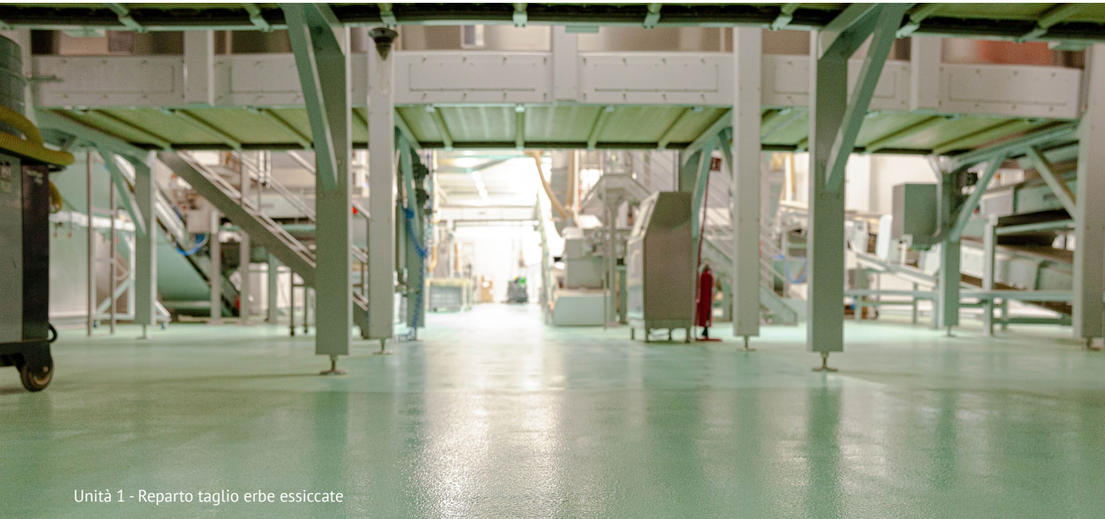
Unità 1 - Reparto taglio erbe essiccate

Azienda italiana leader nell' healthcare sceglie Recodi per le pavimentazioni della sede di Pistrino di Citerna (PG)