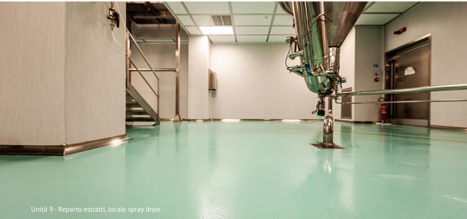
Unità 9 - Reparto estratti, locale spray dryer