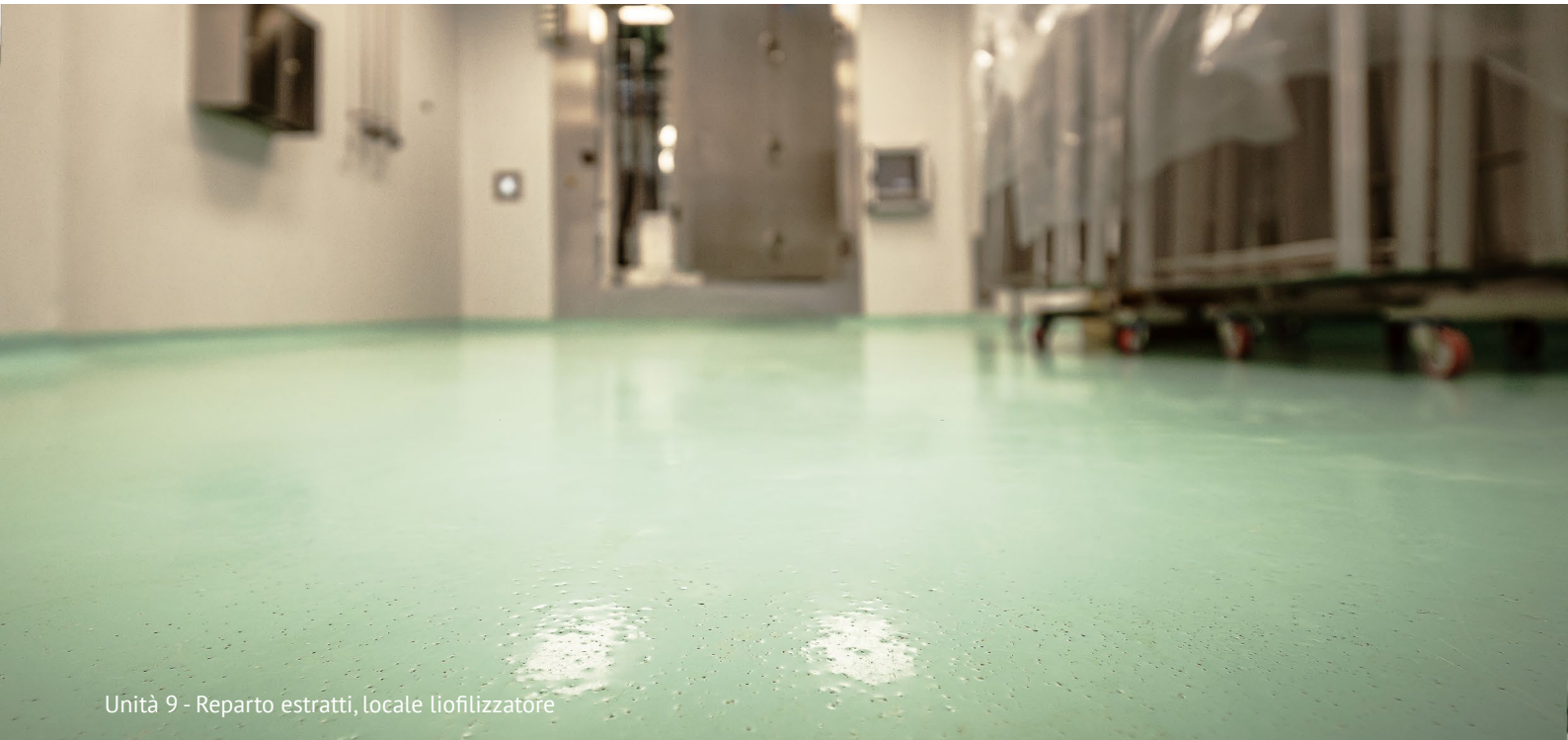
Unità 9 - Reparto estratti, locale liofilizzatore

Al termine della posa del ciclo di rivestimento viene eseguita la prova di conduttività in modo da verificare l'antistaticità in classe I di resistenza a terra secondo la norma UNI EN 1504/2 ( 10^4 \leq R \leq 10^6 \Omega ) relativa ai materiali esplosivi.