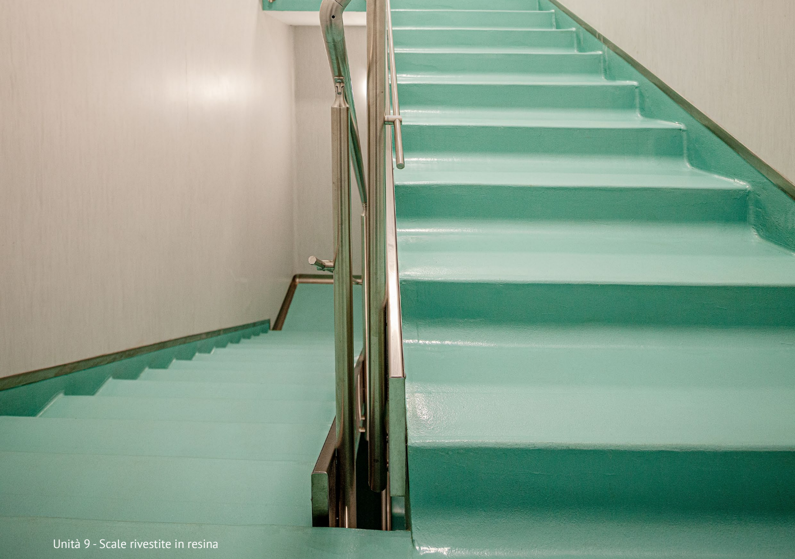
Unità 9 - Scale rivestite in resina