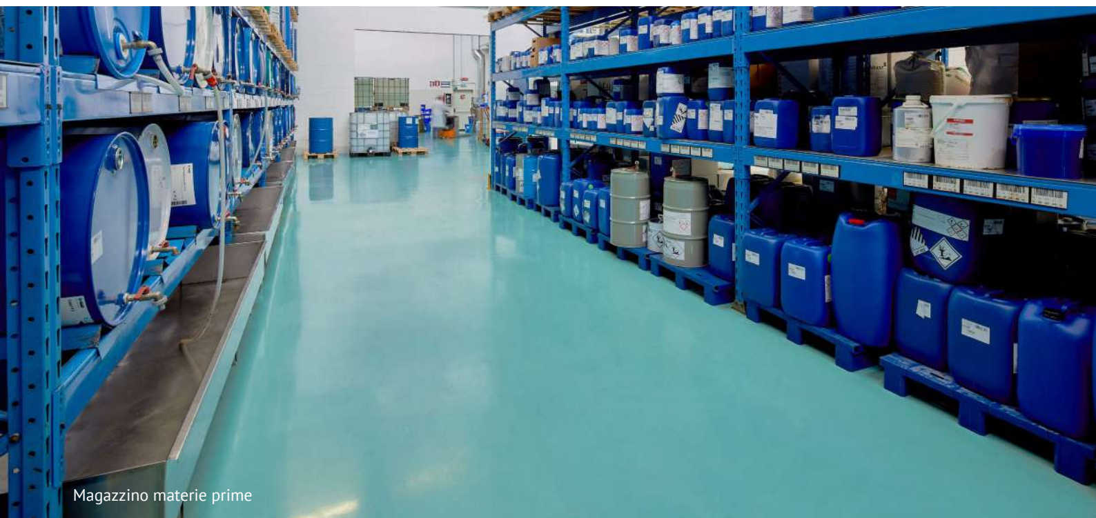
Magazzino materie prime